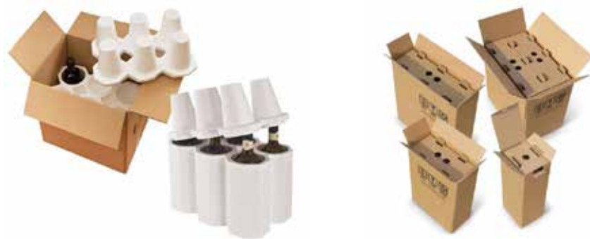
Esempi di confezioni omologate

Le bottiglie devono essere disposte verticalmente se contengono liquidi e deve essere utilizzato un sigillo interno e un tappo forato. Attenzione deve essere data all'imballaggio poiché deve essere in grado di contenere eventuali perdite. Per la spedizione di bottiglie all'estero è necessario utilizzare confezioni omologate dal vettore utilizzato.